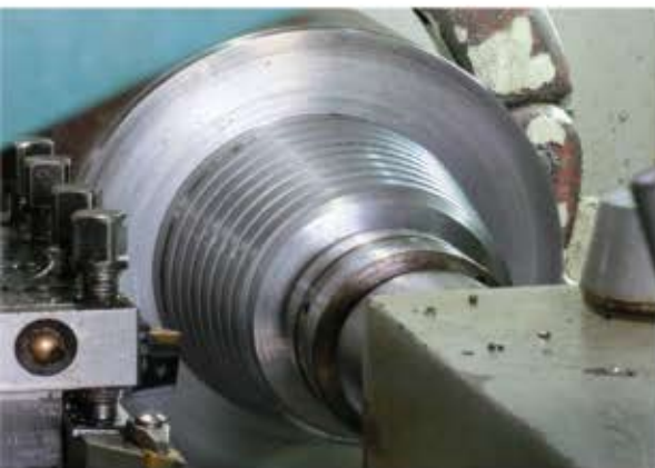
API REG , API IF , API NC , NEW VAM VAM TOP , API NON.UPSET , ACME STUB ACME , BRITISH BUTTRES AMERICAN BUTTRES , FULL HOLE