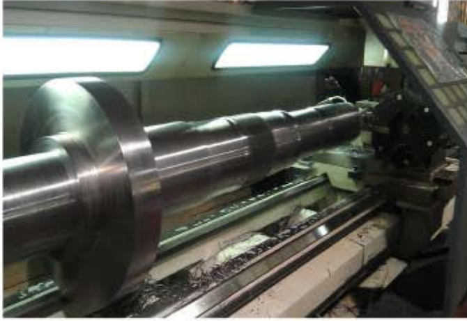
مهندسی معکوس و ساخت قطعات ثابت و دوار انواع پمپ ها، شیرها، توربوکمپرسورها