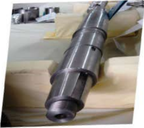
مهندسی معکوس و ساخت انواع شفت ها و پیستون رادهای دقیق و حساس