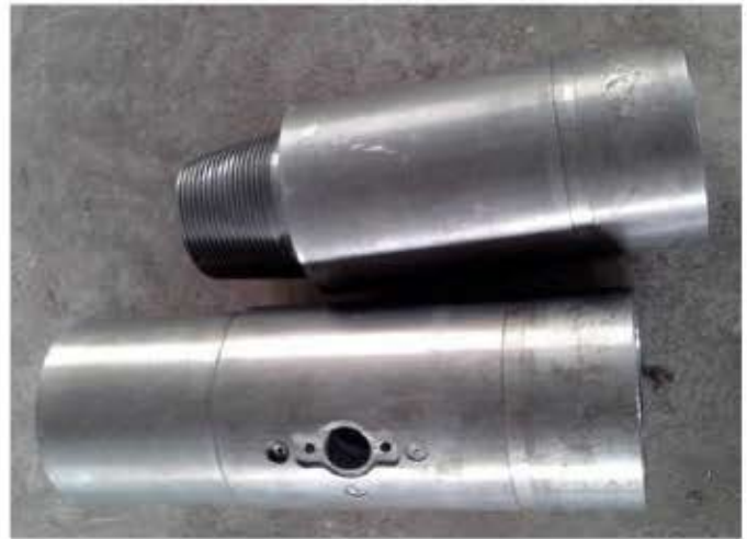
IBOP VALVE - 15000 PSI