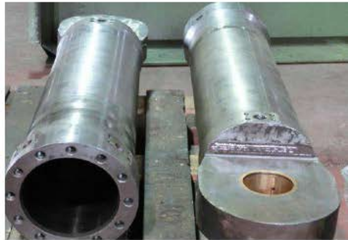
مهندسی معکوس و ساخت قطعات و تجهیزات صنایع سیمان، فولادی و معدنی