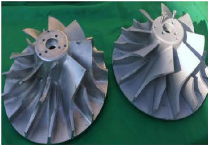
ماشینکاری انواع ایمپلرها در آلیاژهای مختلف