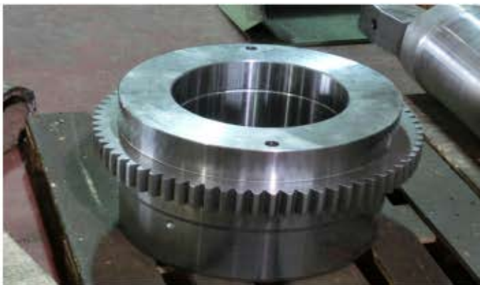
مهندسی معکوس و ساخت انواع گیرکوبلینگ ها و ردیوسرهای صنایع پتروشیمی