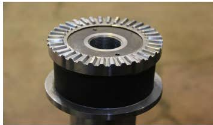
انواع قطعات دقیق و حساس توربینی با آلیاژهای مختلف