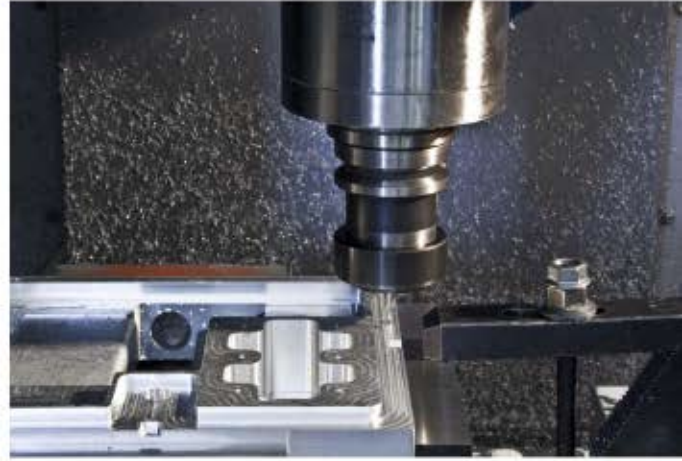
ماشینکاری انواع قالبهای تزریق و برش