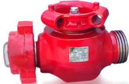
پلاگ ولو سایز ۱ و ۲ اینچ کلاس 15000 PSI